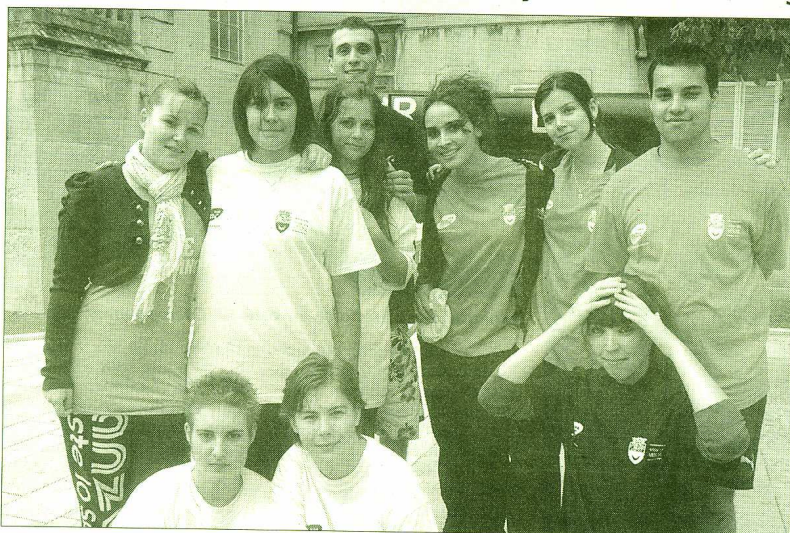
Photo souvenir devant le tir au but.

Environ 250 jeunes ont participé à la 5 e édition de la journée d'intégration inter-étudiante.