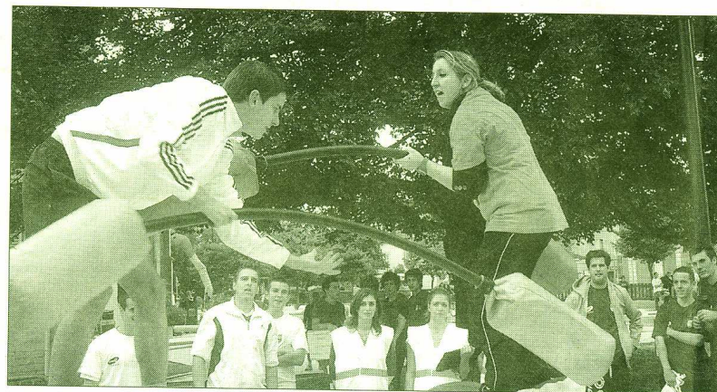
Epreuve de joutes pour les étudiants.