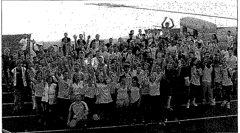
"En HSE, c'est merveilleux!", ont chanté les étudiants de l'IUT de Vesoul-Vaivre, aux côtés des représentants des autres établissements post-bac de la ville.

La Presse de Vesoul RETROUVEZ UNE VIDEO DE CE REPORTAGE SUR NOIRE SITE www.lapressedevesoul.com