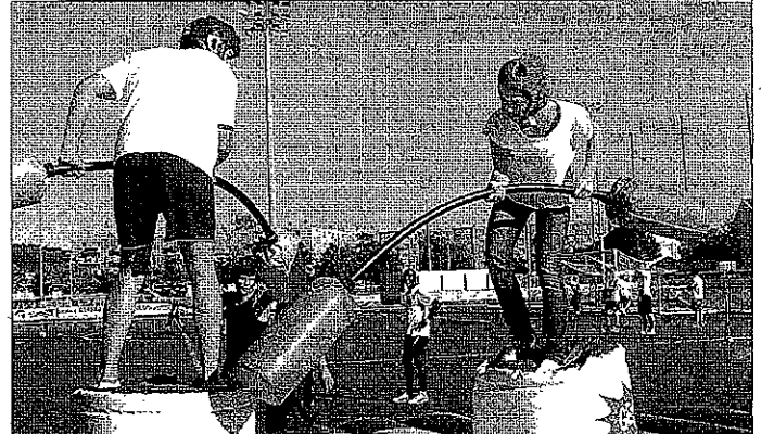
L'épreuve de joutes.