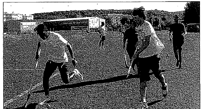
Apprendre à se connaître grâce aux épreuves collectives ouvertes au stade René-Hologne.