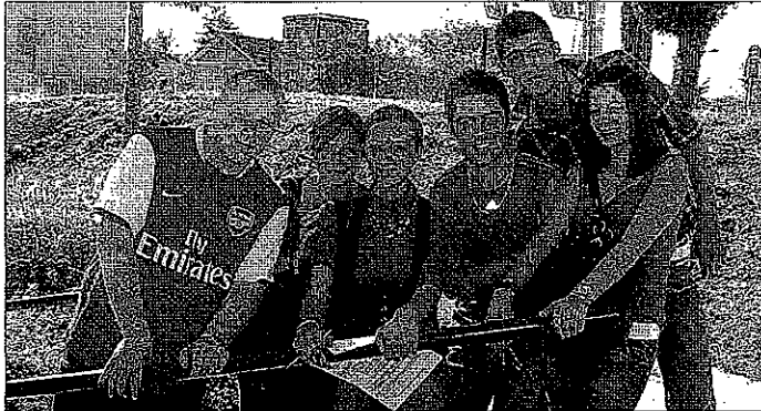
Sur le chemin de l'Espace Jeunes, les Schtroumpfs-Haberges 4 ont fait une halte au passage sous voie.