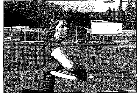
A l'Ultimate, le ballon est remplacé par un frisbee.